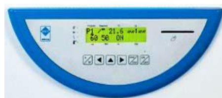
Ovládací panel Climacell