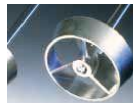
PR31, PR32, PR33