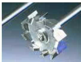
TR 20 – TR 21