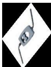
svorka 13- 32