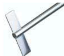
BR 11 – BR 12