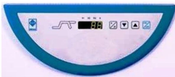
Ovládací panel série štandard