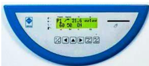
Ovládací panel série Comfort